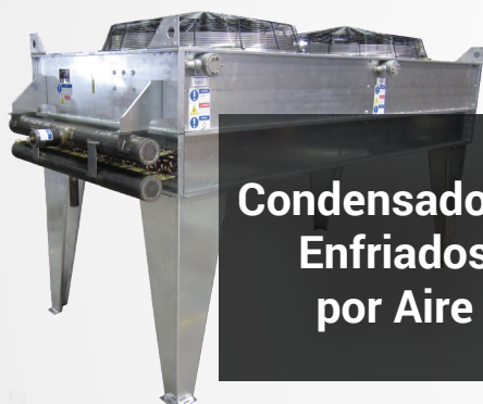
Condensadores Enfriados por Aire