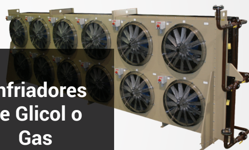
Enfriadores de Glicol o Gas