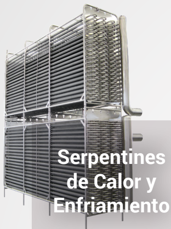
Serpentines de Calor y Enfriamiento