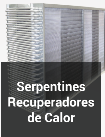
Serpentines Recuperadores de Calor