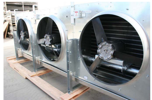
Figura No 12: Unidad sin las guardas protectoras de los motores/ventiladores

La presencia y condiciones de las guardas deberá ser inspeccionada anualmente. En ausencia de las guardas adecuadas personas pueden resultar lastimadas o el producto podría entrar en contacto con las aspas de los ventiladores. Inspeccione visualmente cada evaporador para asegurar que cada ventilador lleve su guarda y en que condición se encuentra. Contacte al fabricante del evaporador para obtener repuestos de estas guardas.