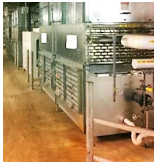
Figura No 10: Unidad montada en piso, sin barreras protectoras.

Los evaporadores que son operados en áreas de alto tráfico de montacargas deberán tener sus barreras protectoras inspeccionadas anualmente. Revise visualmente todas las barreras en busca de cualquier evidencia de daño por montacargas. Las barreras dañadas deberán ser reparadas o reemplazadas. El impacto con un evaporador podría causar daños mecánicos o fugas de amoníaco. Las medidas de prevención incluyen agregar protecciones adicionales, entrenamiento a los operadores para no golpear las barreras protectoras o unidades y agregar señales de advertencia y precaución.