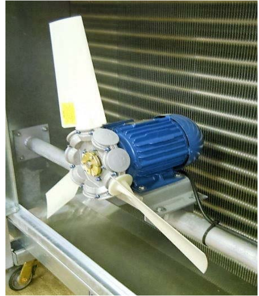
Figura No5: Ensamble típico de motor/ventilador axial

Con los motores apagados, revise el torque de los tornillos que fijan el ventilador al eje del motor. También revisar el torque de los tornillos que sujetan el motor a su base. Pregunte al fabricante de sus evaporadores cual son los torques adecuados. Si no se revisa si hay tornillos sueltos ya sea en la masa del ventilador o la base del motor, podría suceder una falla catastrófica, así como daños mecánicos a los tubos del evaporador y al mismo tiempo resultaría en una fuga de amoníaco. Algo similar puede ocurrir cuando los ventiladores son cambiados en su sentido de giro en operación, provocando la ruptura de aspas, mismas que pueden provocar fugas de amoníaco en el serpentín.