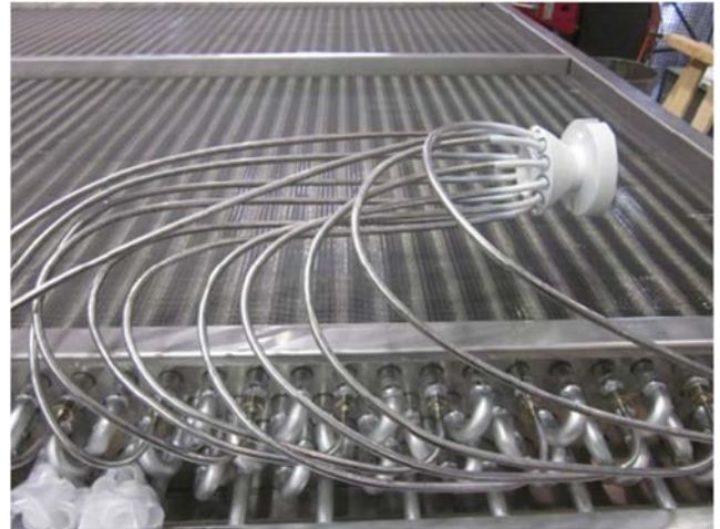
Figura No 7: Ensamble típico de un distribuidor con los "tubings"

Vibraciones excesivas y/o falta de inspección pueden provocar las rupturas de los tubings, tal como se muestra en la Figura No 8, siendo obligada la sustitución completa del distribuidor con todos los tubings