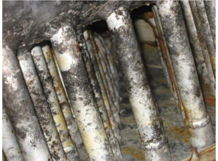
Figura 2: Tubos de serpentines corroídos

Inspeccione la superficie de los tubos, aletas y conexiones de tuberías en busca de picaduras o decoloración desigual. También revise cualquier tubería aislada donde pueda estar en peligro la barrera de vapor. Picaduras excesivas podrían ocasionar una fuga de amoníaco si los agujeros continúan a través del espesor de la pared del tubo o tubería. La corrosión de la superficie de las aletas provoca una reducción de la capacidad de refrigeración, por eso es importante también revisar estas superficies. Inspeccione visualmente todas las áreas del serpentín con una lámpara. Para zonas de difícil acceso, utilice un delgado y flexible animoscopio. Si es posible, medir la profundidad de las picaduras grandes con un micrómetro.