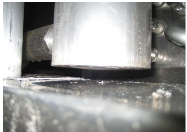
Figura 3: Tapa inferior de cabezal de succión del evaporador "inflada"

siempre permitiendo que la presión de deshielo se iguale antes de abrir la válvula de cierre de succión.