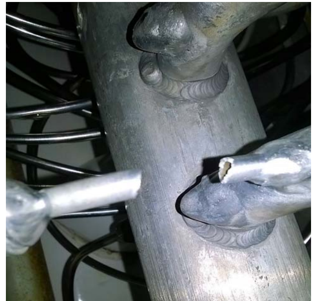
Figura No 8: Falla de tubing causada por tensión excesiva.