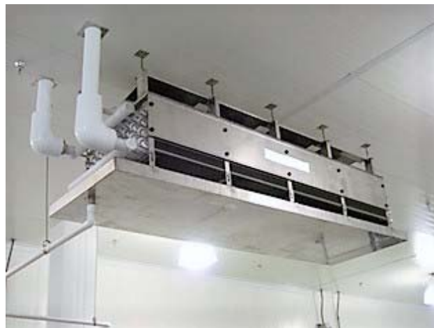
Figura No 9: Unidad suspendida del techo del área refrigerada.

Soportes de tubería inapropiados podrían sobrecargar las conexiones del serpentín, generando una fuga. Cualquier soporte de tubería y unidad que muestre cualquier signo de daño deberá ser reparado o reemplazado inmediatamente.