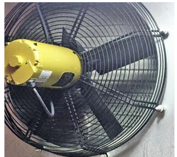
Figura No 6: Ruptura de un aspa causada por cambio repentino de sentido de giro durante operación.