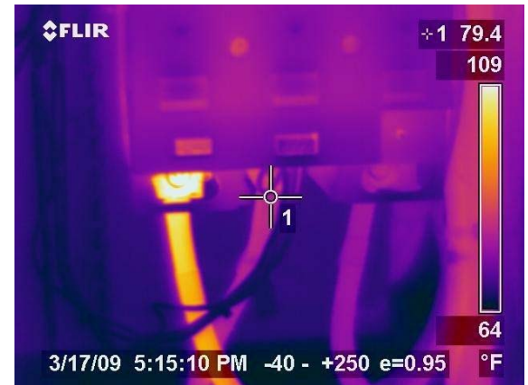
Figura No 11: Fotografía con cámara infrarroja mostrando falla en conector

Los componentes eléctricos montados en los evaporadores deberán ser inspeccionados anualmente. Busque conectores sueltos o signos de sobre calentamiento, tales como manchas negras, aislamiento de cables derretidos o grietas en el aislamiento del cable. Inspeccione visualmente los conectores eléctricos y use una cámara infrarroja para ver componentes sobrecalentados. Cualquier problema eléctrico, si no se corrige, podría provocar un incendio. Contacte a una compañía eléctrica o electricista para reparar o sustituir equipo defectuoso.