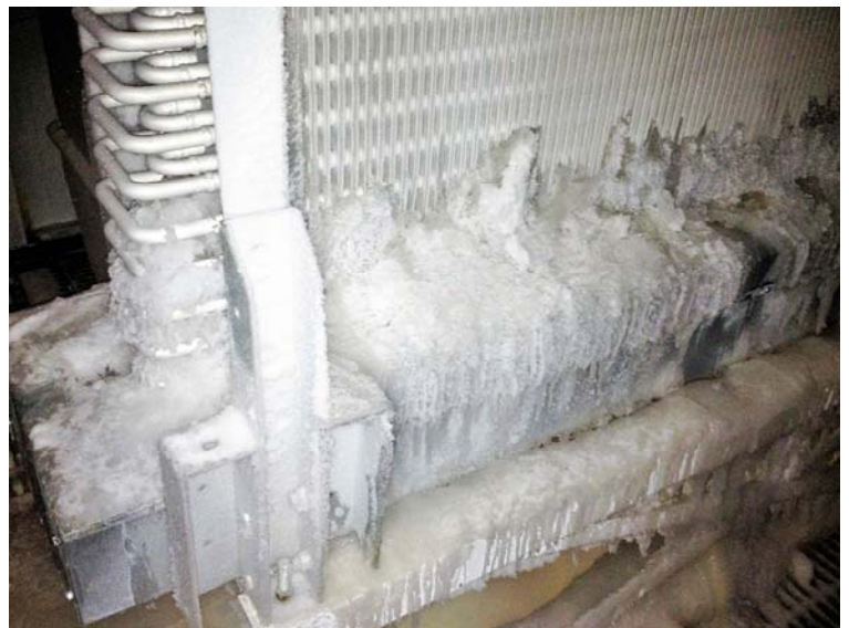
Figura No 1: Acumulación excesiva de hielo en la parte inferior del serpentín y en la bandeja, en un equipo con deshielo por gas caliente

Inspeccionar la acumulación de material en las aletas de todos los evaporadores. Polvo y/o fibras de empaque de producto son las fuentes más comunes de esta acumulación. Revise la acumulación de escarcha en las aletas y bandejas de los evaporadores que operan en áreas de congelación. Una acumulación excesiva de escarcha y material podría interferir con el flujo de aire y reducir la capacidad del serpentín. Una acumulación excesiva de escarcha entre la zona inferior de los tubos y la bandeja podría causar daños mecánicos a los tubos del serpentín y la bandeja. Recuerde que los evaporadores con deshielo por gas caliente comúnmente tienen un arreglo de tubos conectados la bandeja de deshielo. Cualquier daño a estos tubos o los tubos del serpentín podrían provocar una fuga de amoníaco.