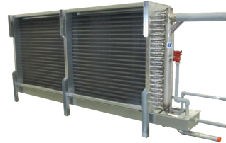
A+B Serpentin independiente solo con bandeja de deshielo