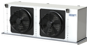
A+E Calidad Industrial para Aplicaciones Comerciales