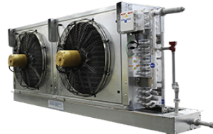
A+S Bajo Perfil