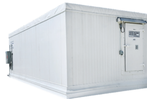
A+P Unidad Penthouse