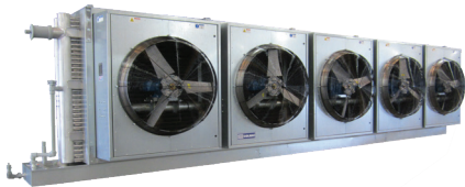
A+L Alto Perfil