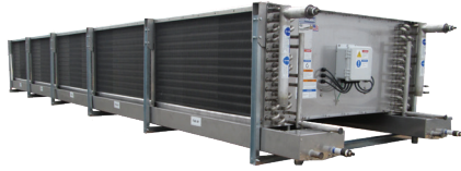
A+D Bajo Perfil con Descarga de Aire Dual

Soluciones a la medida efectuadas por los "Expertos en Transferencia de Calor"