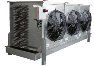
A+M Medio Perfil